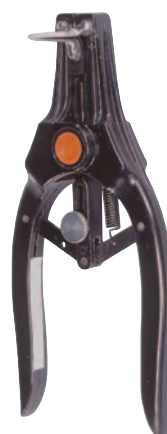
KN se 3 hroty