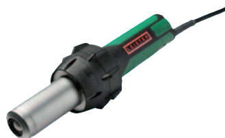
SES-Leister Electron ST 0594 0002 000