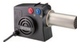
Leister HOTWIND PREMIUM 0594 0050 000