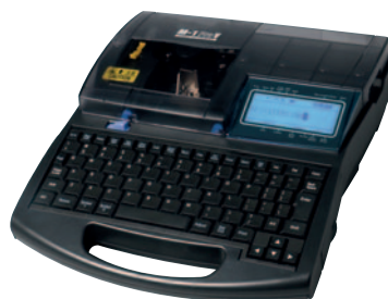
PLIOSCRIB M1-Pro 0378 0500 000

Označovací systémy se kterými lze popisovat mnoho různých smršťovacích hadic: