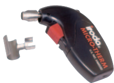
Piezo IRODA 0533 0120 000

Uvedený přehled je výběrem z dodávaného sortimentu horkovzdušných pistolí. Přesné údaje naleznete v kapitole „Nářadí“ D7.